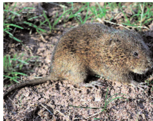
Slika 12: Veliki voluhar.

V zadnjih letih povzročajo v sadovnjakih velike škode tudi glodavci, ptice in divjad. Med glodavci sta pomembna predvsem poljska miš Microtus arvalis , ki obžira debela mladih sadik še posebej pod snežno oddejo in voluhar Arvicola terrestris , ki se prehranjuje s koreninami dreves. Zatiramo ga v februarju in marcu, ko ima škodljivec prvo gnezdo. Zatiramo ga z zaplinjevanjem