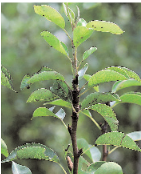
Slika 12: Navadna hruševa bolšica.

Običajno se v začetku maja začnejo izlegati ličinke prvega rodu. Te izločajo medeno roso, nanjo pa se naselijo glive, ki povzročajo sajavost rastlin. Prerazmnožitev