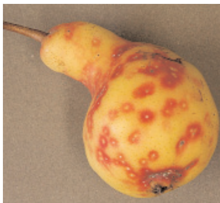
Slika 3: Znamenja poškodb najlaže ugotovimo na plodovih, ki so na povrhnjici vidna kot rdeče obrobljen ščitek. Ščitke najdemo tudi na lubju in listju. S sesanjem sokov na lubju povzročajo odmiranje dreves.