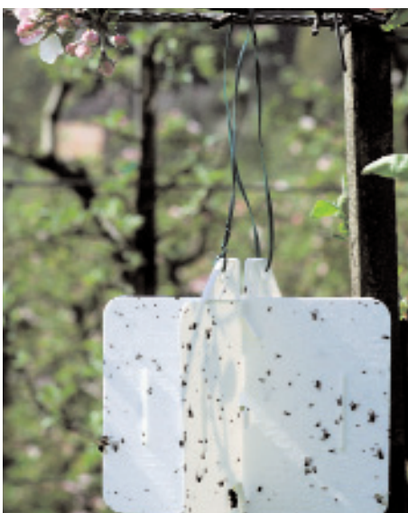
Slika 9: Spremljanje dinamike leta osic na bele lepljive plošče.