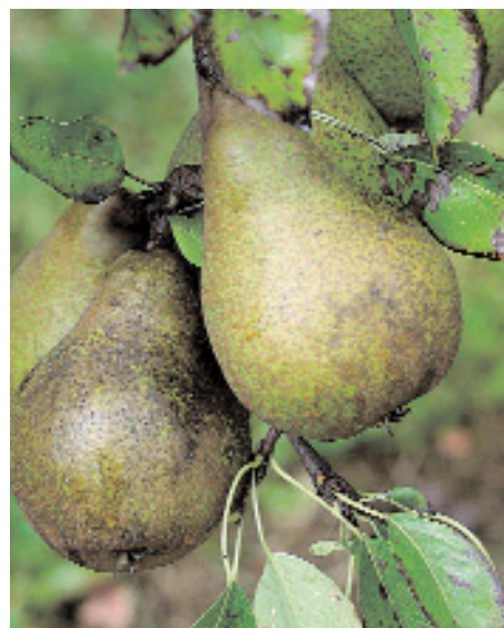
Slika 10: Sajavost na plodovih.

Samo na hruškah pa živi navadna hruševa bolšica Cacopsylla pyri , ki ima na leto po štiri rodove. Odrasle bolšice prezimijo najpogosteje pod odpadlim listjem, lahko pa