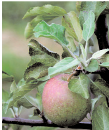
Slika 1: Po zatiranju rdeče sadne pršice Panonychus ulmi izraščajo novi, zdravi listi.

Širjenje pršic omejuje že sama narava, saj jih z drevja izpira dež, napadajo pa jih tudi stenice in predatorske pršice. Sicer pa škodljivca zatiramo z akaricidi, žveplovimi pripravki in s sredstvi s fizikalnim delovanjem (olja, škrobni pripravki itd.). Omejujoči dejavniki zatiranja so: prekrivanje rodov škodljivca, pomanjkanje fitofarmaceutskih sredstev, ki bi sočasno delovala na vse razvojne stadije škodljivca in hiter pojav odpornosti škodljivca na klasične akaricide (rezistenca).