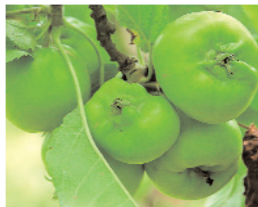
Slika 5: Zaradi sesanja cvetov mokaste jablanove uši se razvijejo deformirani plodovi.

Hruške napada mokasta hruševa uš Dysaphis pyri . Jajčeca prezimijo v razpokah skorje. Napadeno listje rumeni in se močno zvija. Uš izloča obilo medene rose. Poleti se krilate uši preselijo na lako-