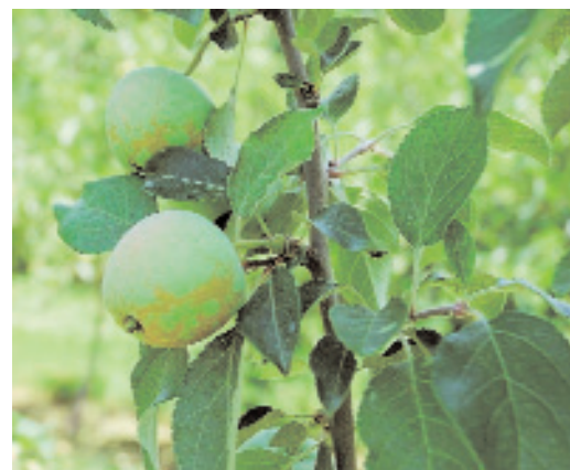
Slika 2: Znamenja sesanje sokov resarjev na plodičih, se kažejo potem kot mrežasta krastavost na plodovih.

so majhne, do 2 mm velike žuželke z resastimi krili. Najpomembnejši čas za spremljanje napada tega škodljivca, ki povzroča škodo s sesanjem plodičev, je obdobje od brstenja do cvetenja.