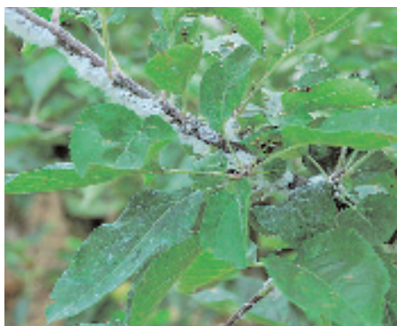
Slika 4: Kolonije krvave uši prekrte z belimi voščeniimi vatastimi nitmi.

Krvava uš prezimi na jablanah v različnih stadijih, največkrat pa v stadiju ličinke na koreninskem vratu ali koreninah. Samica