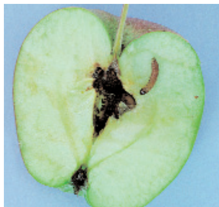
Slika 6: Črvihost povzročajo gosenice, ki se zavrtajo v peščišče. Takšni plodovi predčasno odpadajo in so podvrženi gnitju.

Pri nas ima jabolčni zavijač dva rodova na leto, včasih tudi tri. Prezimi v razpokah lubja kot gosenica. Samica odlaga jajčeca v mraku, ko so temperature zraka nad 15 °C. Optimalna temperatura zraka za let