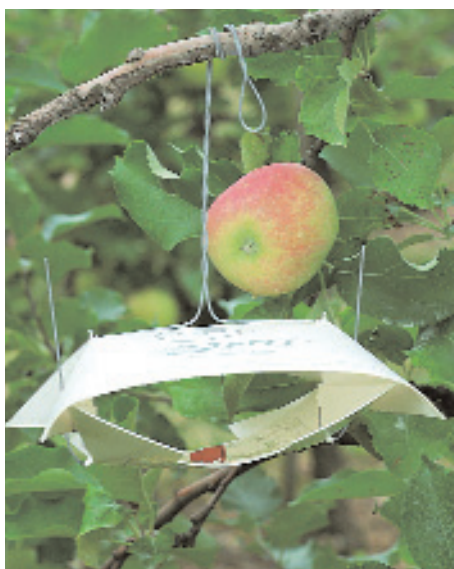
Slika 7: Spremljanje leta metuljčkov jabolčnega zavijača na feromonske vabe.

tudi pod starim lubjem, v razpokah ter v podobnih skrivališčih na drevesu. Samice začnejo odlagati jajčeca v času odganjanja brstov, potem pa se odlaganje jajčec nadaljuje na zelene dele rastlin. Pri tem vsaka samica odloži od 300 do 600 jajčec. ▶