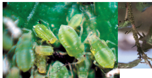
Zelena listna uš - povečano - in kolonija zelene jablanove uši (desno).

tinilne pripravke (actara 25 WG, mospilan, confidor SL 200, kohinor SL 200 in calypso SC 480) in pirimor 50 WG, ki ima odlično stransko delovanje tudi na krvavo uš. Stransko delovanje na listne uši imajo še pripravki basudin 600 EW, diazol 50 EW in diazinon 20. Pragovi škodljivosti za listne uši so prikazani v preglednici 1.