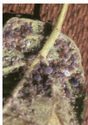
Kolonija mokaste jablanove uši na spodnji strani lista; foto: arhiv revije Sad.